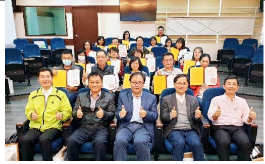
結業式頒發研習證書