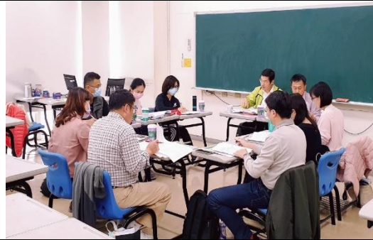
分組模擬試題解析