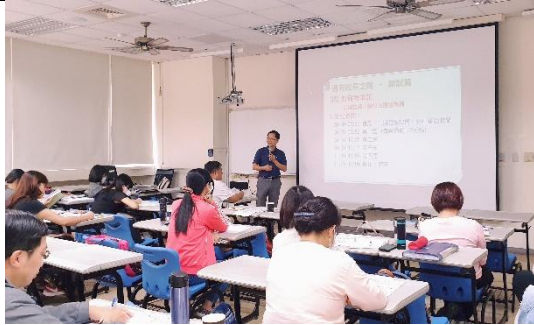
資深校長經驗分享